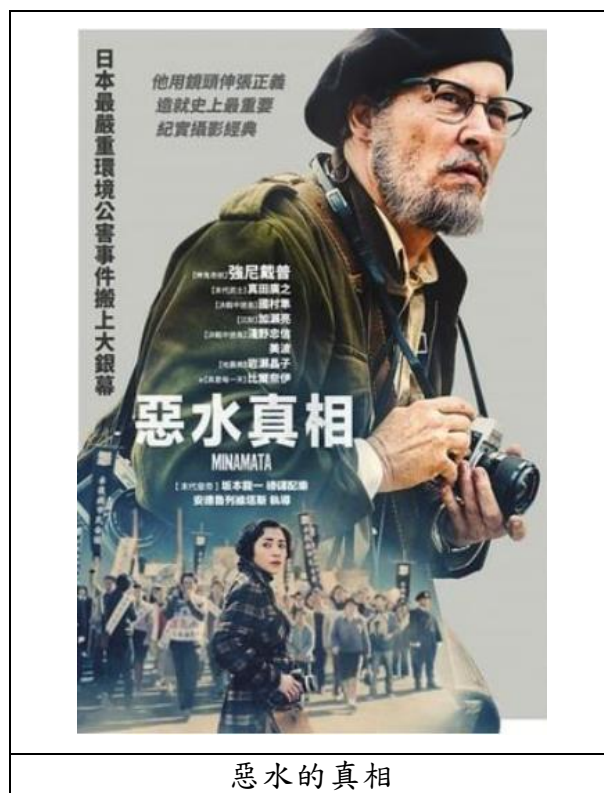
圖 1 惡水的真相電影海報

美國戰地攝影師尤金史密斯，以血腥逼真的二戰照片聞名。戰後尤金隱居，與社會脫節。受《生活》雜誌編輯羅伯特所求，尤金復出前往日本熊本縣水俣市，那裡有疑似有水銀污染事件，許多居民染上怪病。尤金用相機紀錄受害者的實況，透過震懾人心的照片，向全世界揭露這起災難的真相，試圖挽救當地人的命運。