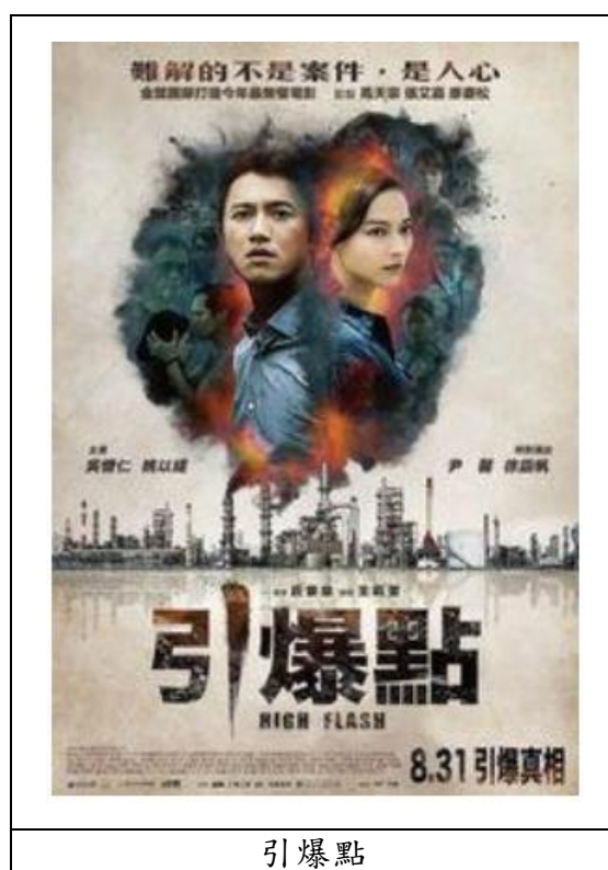
圖 2 引爆點電影海報

透過議員牽線，想跟陳縣長私下交涉、周法醫解剖阿海屍體，判斷他不是自焚而亡、金檢察官暗中調查通聯石化廠兩年時間，想要藉此案件一舉打倒通聯，卻遭受來自上級的壓力；究竟阿海的死亡真相為何、這場寶港村民與財團與檢察官、正義與真相之爭，會如何收場？